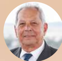
Jerfferson Simões Presidente da World Security Federation (WSF)